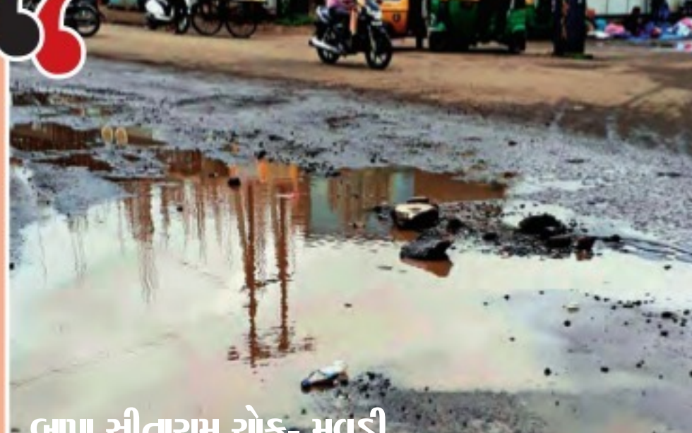
નાપા સીતારામ ચોક- મવડી