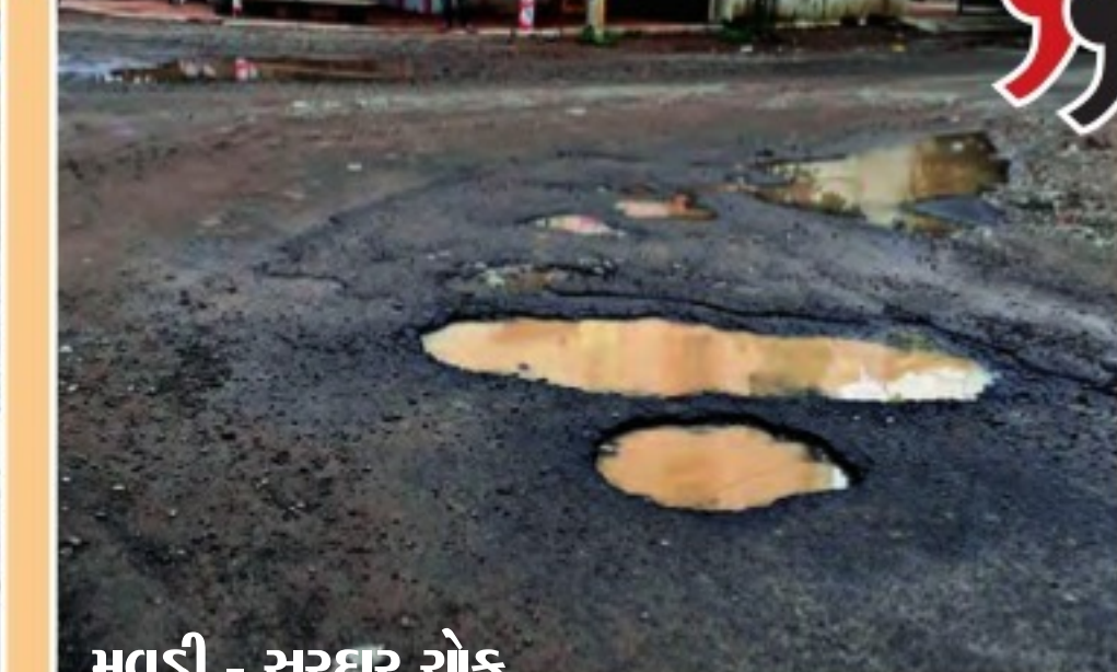
મવડી - સરદાર ચોક